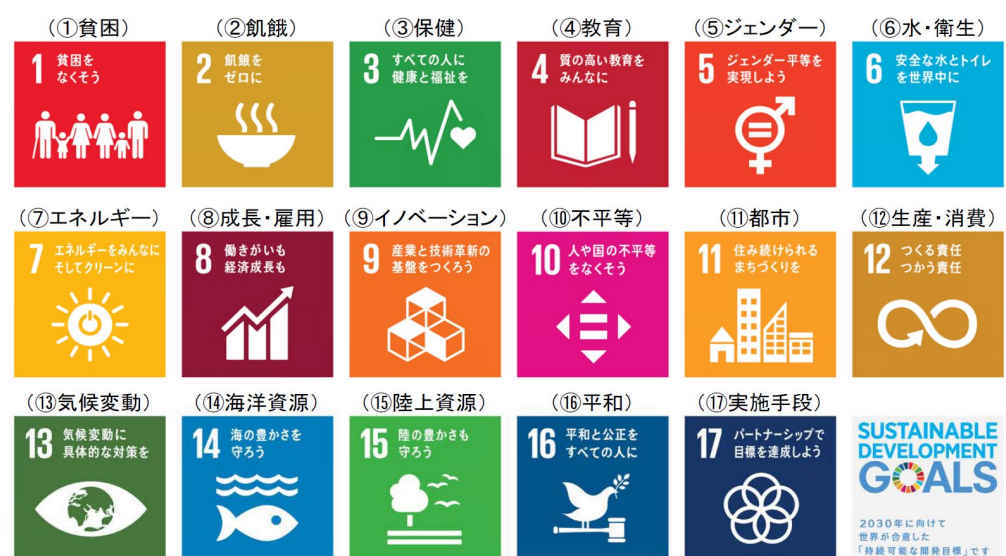
ロゴ：国連広報センター作成